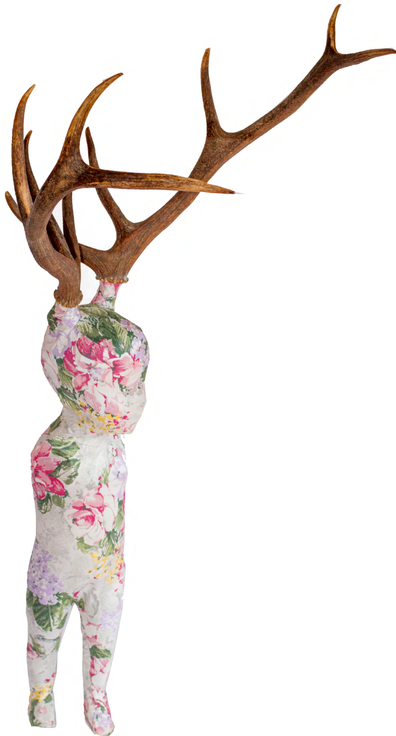
DDR Art Gallery Roberto López Avatar El Elegido Tela sobre fibra de vidrio y resina 150 x 30 cm 2016